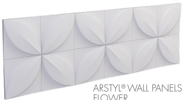
ARSTYL® WALL PANELS FLOWER

Met ARSTYL® WALL PANELS FLOWER van NMC kunnen doelgericht highlights in een vertrek worden aangebracht. Het driedimensionale paneel is in het bijzonder geschikt voor een levendig maar tegelijkertijd ook fijn spel van licht en schaduw.